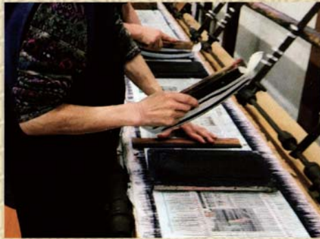
櫛押捺染 糸に柄となる染料をつける作業