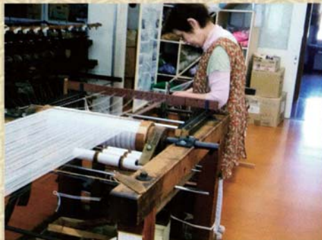
機巻き 経糸を張りながら柄を合わせ、巻きたる作業