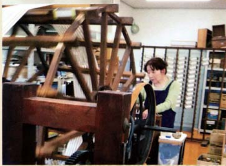
経糸整経 着尺巾に経糸を必要な長さに整経する作業

巾着、財布など小物から反物、のれんまで種類豊富な品々の販売を致しております。値段もお手頃になっておりますので、お土産にどうぞ！